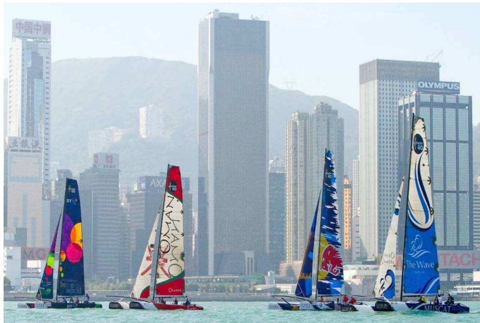
Internationale Regatta im Hafen von Hong Kong

Der Eintritt in den Verein beträgt für unsere Verhältnisse eine hohe Einmalzahlung von ca. 6.000 Euro und eine monatliche Mitgliedsgebühr von ca. 80 Euro. Dafür kann man aber auch die gesamten Einrichtungen