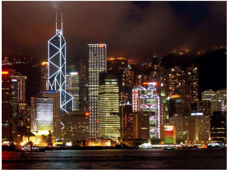
Skyline von Hong Kong Island

angenehmen Temperaturen von ca. 25°C genießen. Als wir um die Ecke in die Hafengegend von Hong Kong kamen tauchte die gigantisch beleuchtete Skyline von Hong Kong auf. Wie es erschien sind da tausende von in den Himmel ragenden Glaspaläste der Banken und Handelshäuser. Alle sind beleuchtet und viele mit gi-