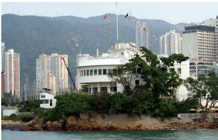
Royal Hong Kong Yacht Club – Causeway Bay

Am nächsten Tag die übliche Routine mit Frühstück im Hotel, Taxi ins Büro und dann gingen die Verhandlungen weiter. Aber wir waren so effektiv, dass wir schon um drei Uhr fertig waren. Noch schnell ein paar E-Mails bearbeiten und dann mit meinem besten chinesischen, langjährigen Kollegen ein Bier trinken gehen. Was ich bis dahin nicht wusste, war dass ich diesen Kollegen im Laufe der Jahre mit meinen Erzählungen über unsere Segelaktivitäten so beeindruckt hatte, dass er sich vor einigen Monaten dazu entschlossen hatte das auch einmal auszuprobieren. Er fand eine Gelegenheit bei den allwöchentlichen Samstagsregatten des RHKYC (Royal Hong Kong Yacht Club) bei einem erfahrenen Skipper als Deckshand anzufangen. Doch dazu mehr später.