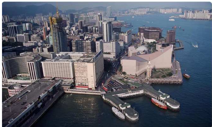
Pier 9 auf Hong Kong Island

mitten durch einen der betriebsamsten Häfen Südostasiens. Hunderte von Frachtschiffen an unzähligen Anlandungsstellen, auf dem Wasser und vor Reede wartend erscheinen Teil eines riesigen, chaotischen Balletts zu sein. Dazwischen finden sich Bagger, Schnellfähren, die